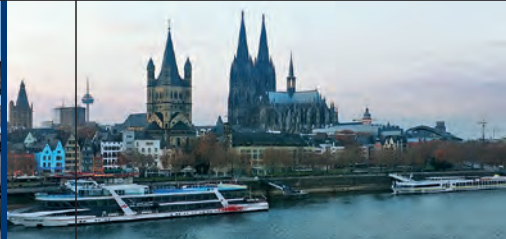
Kölner Stadtführer e.V.