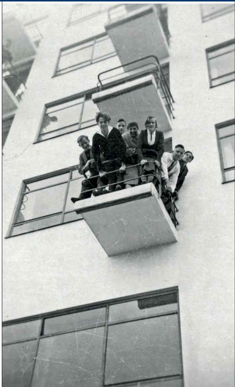
Foto Seite 49: Dessau Bauhauskölle, Studenten der Bauabteilung auf dem Balkon des Ateliergebäudes, 1931/1932.