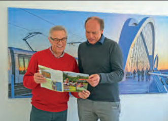
Kehl am Rhein