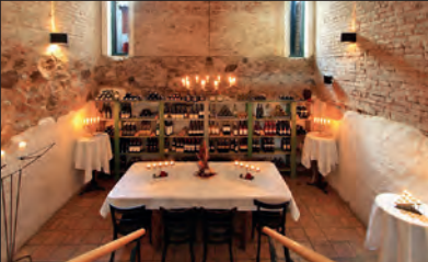
Stechlin – Ruppiner Land