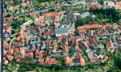
Steinau an der Straße