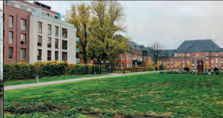
Hamburger Gästeführer Verein e. V.